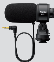
Microphone stéréo ME-1